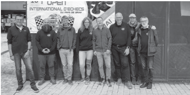
Ein Teil der Grunbacher Delegation

Alle Teilnehmer*innen waren begeistert und freuen sich schon auf die Schachreise 2027. Gerd Huchel